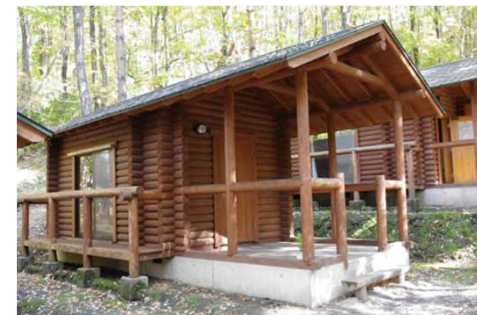
●田沢湖キャンプ場（バンガロー）