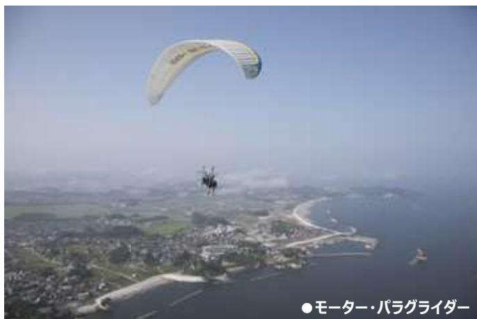
●モーター・パラグライダー