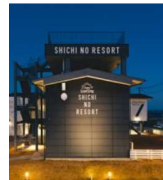
●シチリゾート（外観）