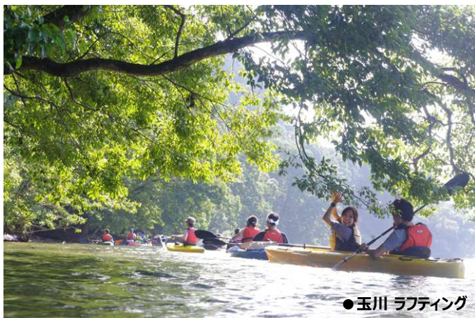
●玉川 ラフティング